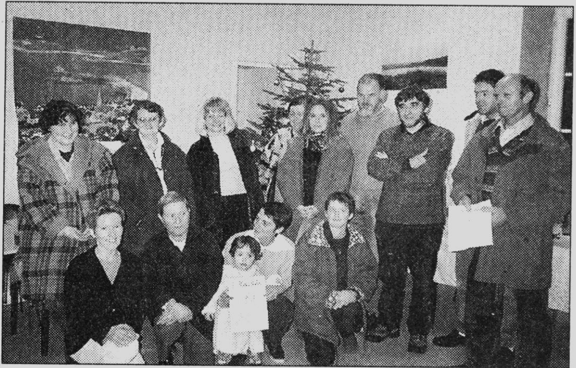
Les treize enseignants participent au projet.

Cette mise en réseau permettra de mettre en commun les compétences diverses des enseignants et palliera parfois au manque de moyens de certains. Ségolène Royal voulait que les écoles rurales s'organisent. Et bien, c'est fait pour ces six écoles.