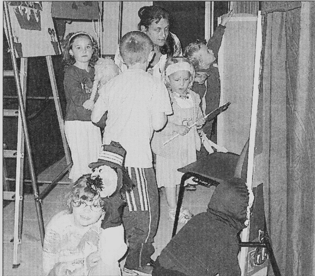
Les enfants de maternelle et CP en préparation du spectacle.

École : un spectacle de marionnettes fait par la classe de petits