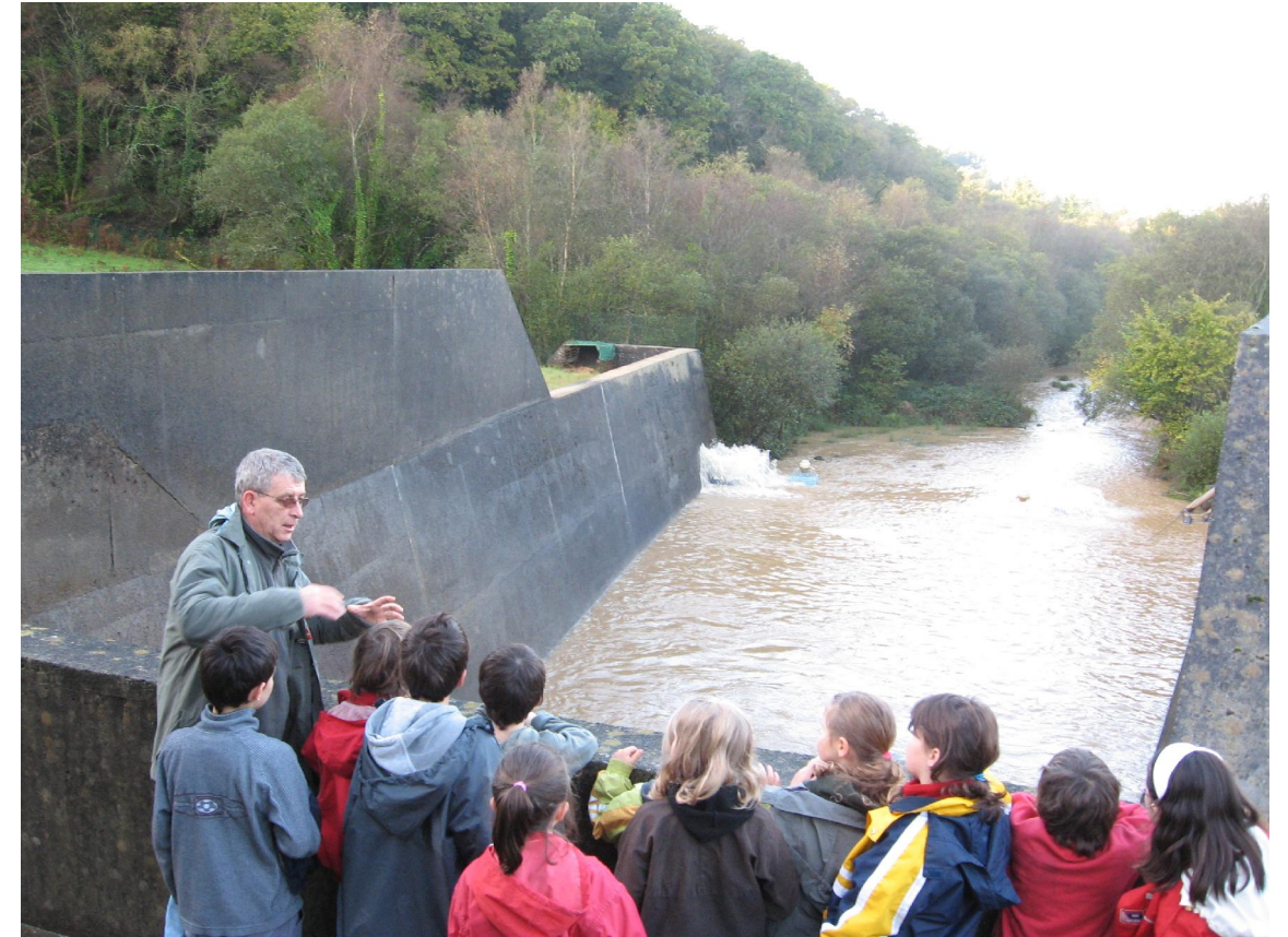
E Stank an Drenneg | Au barrage du Drennec

Un fest-noz aura lieu à partir de 21 h ce même samedi, à la salle polyvalente. Il sera animé par : les chanteurs Kanerien Sant Riwal, Caradec - Huellou et les musiciens Cornec - Miossec et Renard, Entrée 5€.