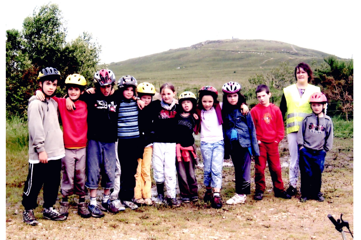
Oc'h ober tro Tuchenn Mikêl war velo | Tour du mont St-Michel à vélo