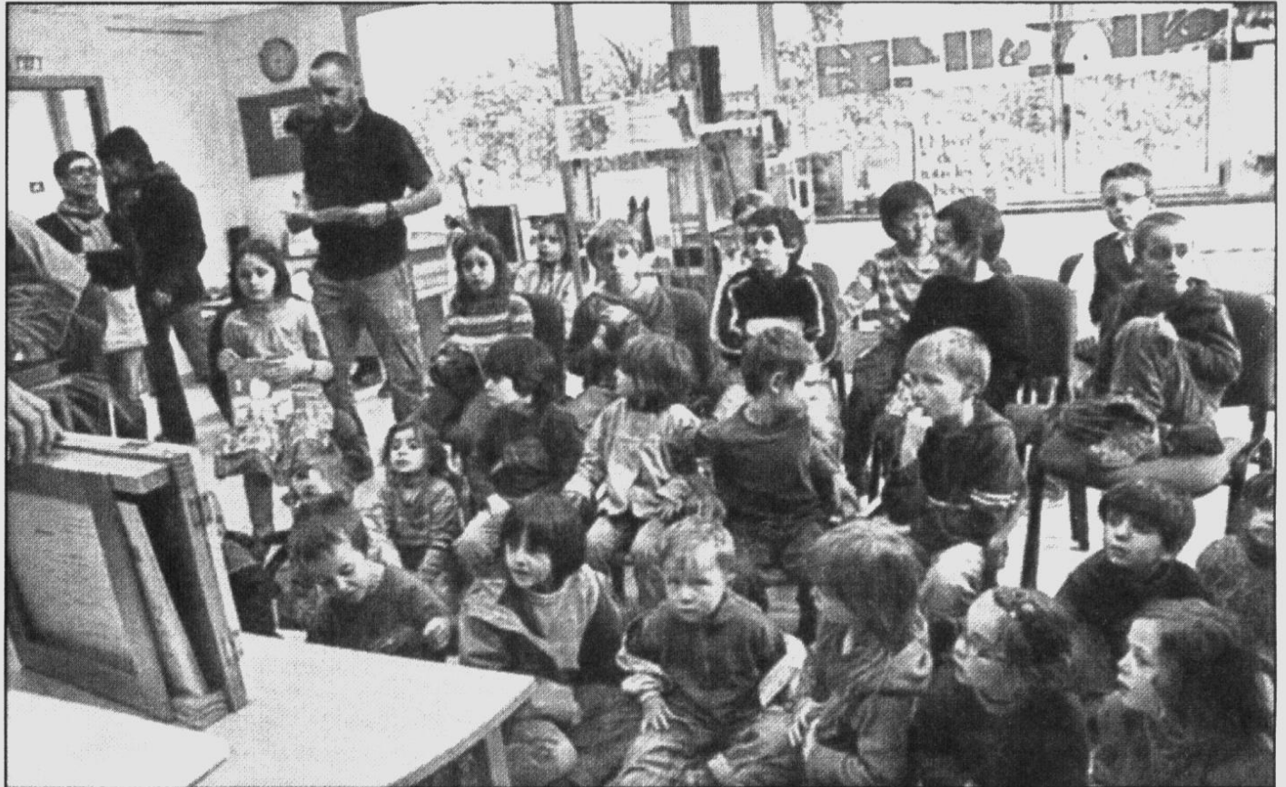
Les écoliers ont écouté les jolies histoires de la séance de kamishibai, avant le vernissage de leur exposition.

Le vernissage de l'exposition avait lieu vendredi, après que les écoliers aient bénéficié d'une séance kamishibai. L'après-midi s'est terminé