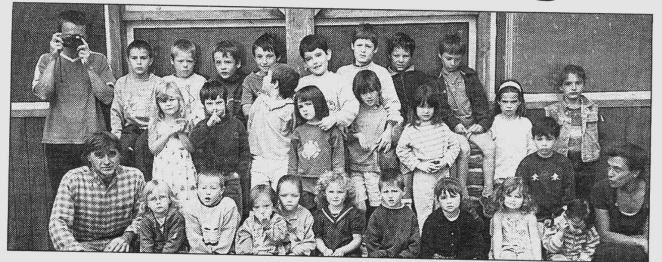
● Les enfants devant le préau avec leurs professeurs.

L'école publique bilingue de Saint-Rivoal se porte bien avec ses 27 élèves. 13 élèves viennent de la commune, des nouveaux venus se sont inscrits pour la rentrée scolaire.